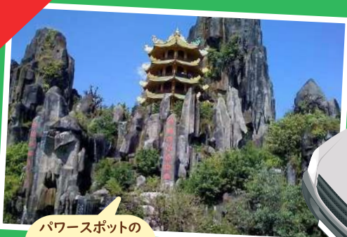
パワースポットの マーブルマウンテン (五行山)も停車 スポットです！