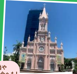
龍橋や ダナン教会へも！